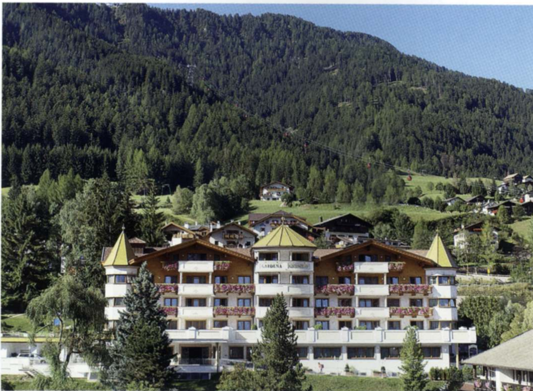
Bergsommer im Grödnertal: paradiesische Zeit für Naturfreunde.

Das Grödnertal mit seinen berühmten Dolomitengipfeln zählt zu den faszinierendsten Bergregionen weltweit. Der Grödnerhof liegt im Bergdorf St. Ulrich im Herzen dieser einmaligen Naturlandschaft. Ein völlig neu gestaltetes, erlesenes Urlaubsdomizil mit facettenreichem Angebot für Freizeitaktivitäten wie für Beauty & Wellness. 51 luxuriös eingerichtete Zimmer und Suiten präsentieren sich mit Charme und Eleganz. Die Küche macht von morgens bis abends mit kulinarischer Vielfalt Freude, von der großen verführerischen Auswahl beim Frühstück bis zu den raffinierten Mittags- und Abendmenüs mit ausgesuchter Weinbegleitung. Der Bergsommer im Grödnertal ist für Wanderer, aber auch für Mountainbiker ein Paradies: steile Felswände, Wiesen, Bergseen, tiefe Wälder, herrliche Wege und Klettersteige, dazu die Gartenlandschaft gleich ums Haus – man erlebt Natur pur. Für Skiaktivisten ist der Grödnerhof ein optimaler Stützpunkt. Man